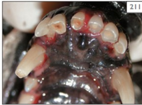
Şekil 6: Üst İnsisiv Dişlerde Dental Atrisyon

Normal oklüzyona sahip kedi ve köpeklerde insisiv dişlerin ve molar dişlerin oklüzal yüzeyi hariç klinik olarak görülmez. Yaşlı köpeklerde, maksillar dişlerin insizal çıkıntısının damak yönü ve mandibular kesici dişlerde insizal sırtın labial yönünde bazı yıpranma kayıpları meydana gelebilir. Düz yüzeye sahip insisiv dişler, aşınma yüzeyi düz veya açılı olarak görülür. Aşınma sonucu üretilen tersiyer dentin dişte kahverengi bir görünüm oluşmasına neden olur. Şiddetli aşınma dişte pulpanın açığa çıkmasına ve ilerleyen dönemlerde pulpa ölümüne neden olur (Adepu ve ark 2018).