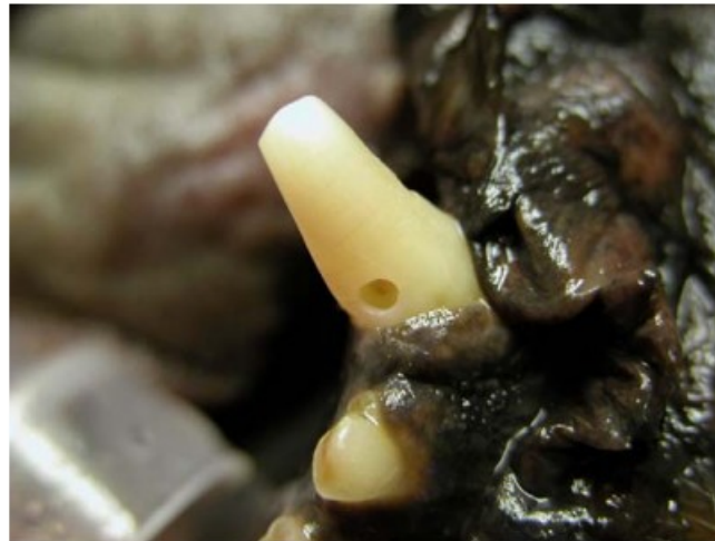
Şekil 9: Köpekte Kanin Dişe Erişim

Eğelerin ve dolgu malzemesi girişi için diş yüzeyinde açılan deliktir. Erişim alanı oluşturulurken bir sonraki adımda yapılacak işlemi düşünerek erişim yapılmalıdır çünkü kök kanalını temizleme ve şekillendirme için apekse olabildiğince düz bir hatta giriş yeri oluşturulmalıdır. Erişim yeri ana kon ve eğelerin pulpa boşluğuna rahatlıkla girebilecek genişlikte olmalıdır. Böylece ana kon ve eğeler erişim açıklığında serbestçe hareket edebilir. Kırık dişlerde genellikle kırık yerinden ulaşılması önerilir ama dişin kırık noktası yukarıda söz edilen kriterleri karşılamıyorsa dişin kırılma yeri her zaman iyi bir erişim noktası olmayabilir. Sağlam kron sahip canin dişlerde pulpaya daha yakın alan olması için diş eti marjininin 2 cm yukarısında giriş yeri açılmalıdır. İki ve üç kök yapısına sahip premolar ve molar dişlerde distal mesial yönlerinde yaklaşım yapmak gerekir (Naeini ve ark 2010).