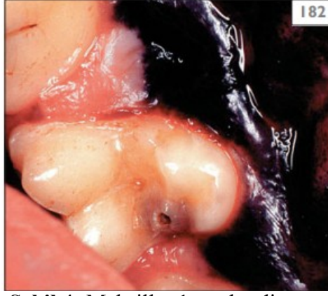
Şekil 4: Maksillar 1. molar dişte çürük