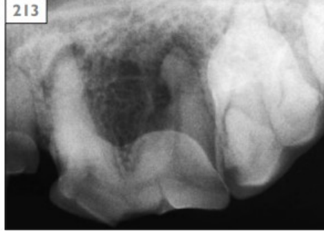
Şekil 7: Alveolar Kemik Rezorbsiyonunun Radyografik Görünümü