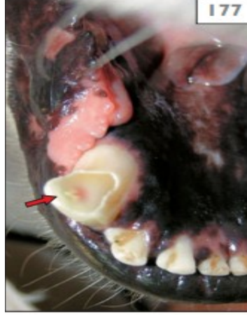
Şekil 3: Komplikasyonlu Kron Kırığı (Pulpitis)

Komplikasyonlu kron kırıkları, komplikasyonsuz kron kırığına benzer ancak komplikasyonlu kron kırıklarında dişin ortasında 1 mm daha küçük açıklıktan başlayıp bazen genç köpeklerde 2 mm ye kadar varan bir boşluk bulunur. Bu boşluk pulpanın canlı olduğu olgularda kırmızı veya pembe renkte görülür ancak pulpanın nekrotik olduğu olgularda boşluk siyah renkte görülür (Desai ve Chandler 2009).