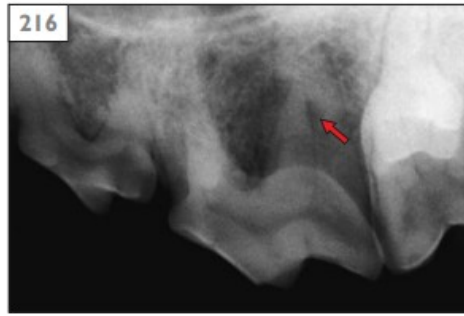
Şekil 8: Üst 4. Premolar Dişte İnternal Rezorbsiyonun Radyografik Görünümü

İnternal diş rezorbsiyonu klinik olarak asemptomatiktir ancak radyografik olarak belirlenebilir. Radyografik olarak diş kökü veya pulpası radyolüsent görülür ve pulpa boşluğunda genişleme tespit edilebilir. Ancak şiddetli bir internal rezorbsiyon kısa süre içerisinde dişte dentin kaybına sebep olarak diş kaybına yol açabilir (Fristad ve ark 1997).