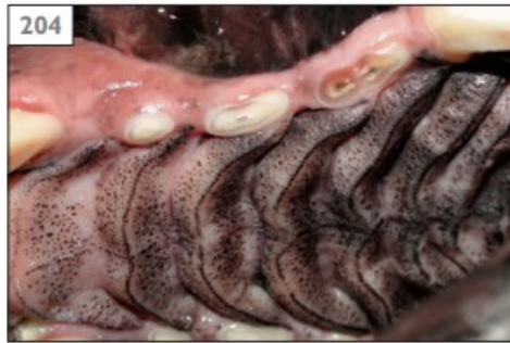
Şekil 5: Maksillar 3. Molar Dişte Dental Abrazyon Ve Açık Pulpa

Kanin dişlerin yassı yüzeyleri ve molar dişlerin yüzeylerinde daha çok aşınma meydana gelir. Diş aşındıkça, pulpa daha koyu renkte olan tersiyer (onarıcı) dentin üretimi gerçekleştirir. Aşınma yüzeyi genişledikçe geri çekilen pulpa boşluğu ve pulpa boynuzu üzerine karşılık gelen aşınmış dentin üzerine karşılık gelen alanda kahverengi dairesel bir alan görülür. Aşınma pulpanın yanıt vermesi için yeterince yavaş ilerlerse de pulpa dokusu geri çekilir ve canlı kalabilir. Aşınma pulpanın yanıt vermesinden daha hızlı ilerlerse pulpa dokusu dış ortama açılarak enfektif hale gelir ve olay pulpa nekrozuyla sonuçlanır (Özçelik 2000).